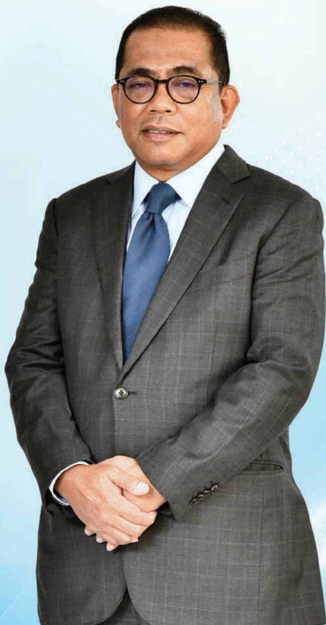
MENTERI PENDIDIKAN TINGGI YB DATO' SERI MOHAMED KHALED BIN NORDIN SIMP., SPMP., DSPN., SMJ., PIS.