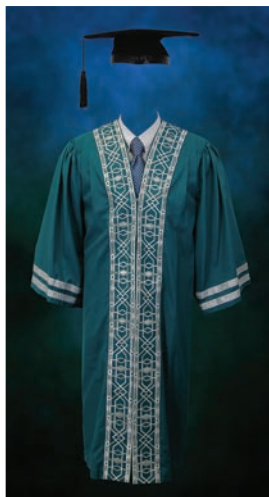
Jubah Graduan Sarjana