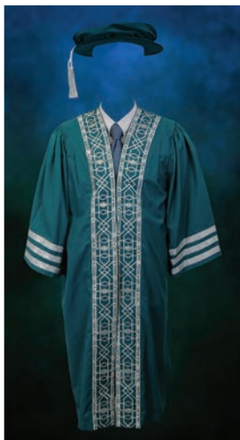
Jubah Graduan Doktor Falsafah