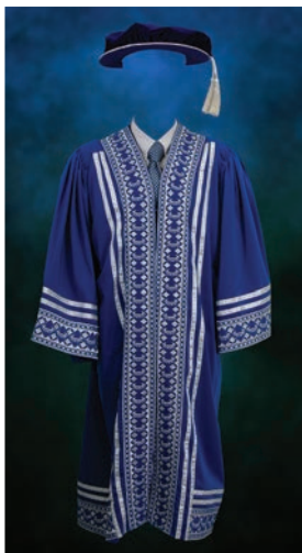
Jubah Ahli Lembaga Pengarah Universiti