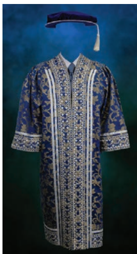
Jubah Naib Canselor