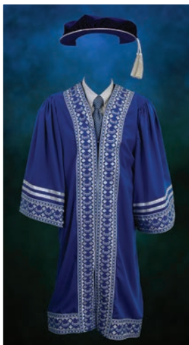
Jubah Ahli Senat Universiti