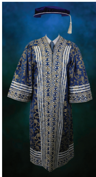
Jubah Pro-Canselor (II)