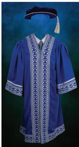
Jubah Pensyarah Universiti

Jubah Ahli Lembaga Pengarah Universiti, Pegawai Utama Universiti, ahli senat dan juga pensyarah adalah berwarna biru cerah dan bersulam di bahagian lengan, lapel dan kaki. Manakala warna sulaman pula adalah sama dengan jubah Menteri Pengajian Tinggi, Pengerusi Lembaga Pengarah Universiti dan Naib Canselor.