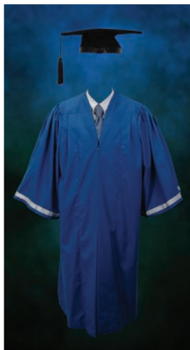
Jubah Graduan Diploma

Warna asas bagi jubah graduan doktor falsafah, sarjana dan sarjana muda adalah warna hijau firus. Manakala jubah graduan diploma pula berwarna biru. Semua jubah mempunyai sulaman bermotifkan logo UMP pada lapel kecuali jubah graduan diploma tiada sulaman.