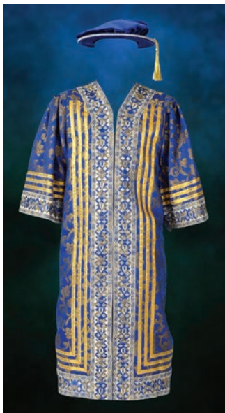
Jubah Pro-Canselor (I)