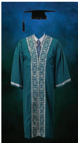
Jubah Graduan Sarjana Muda