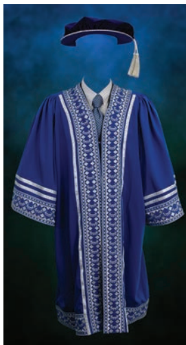
Jubah Pegawai Utama Universiti